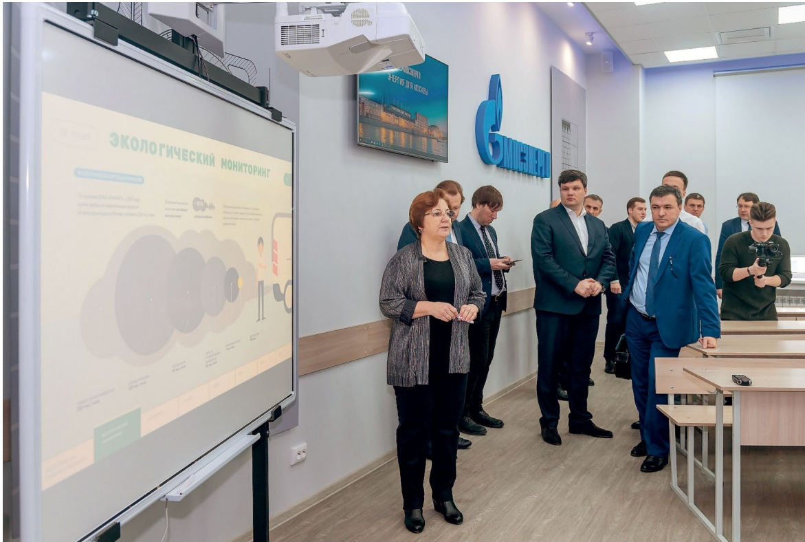
Презентация учебного модуля «Экологическая политика Мосэнерго»