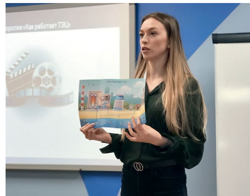
На встрече со студентами МГКЭИТ

студентов МГКЭИТ была организована экскурсия на ТЭЦ-9, в ходе которой они смогли вживую познакомиться с процессом производства электроэнергии и тепла.