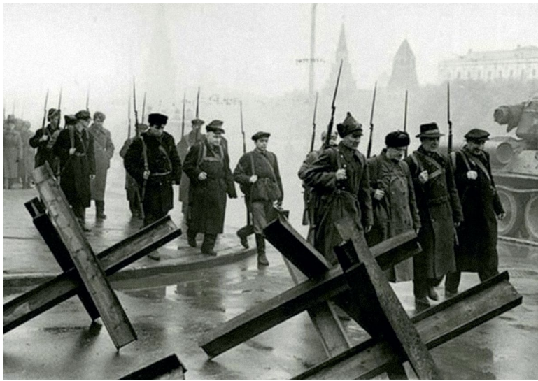
Народное ополчение. Москва, 1941 год

Из воспоминаний московских энергетиков – участников Великой Отечественной войны и тружеников тыла