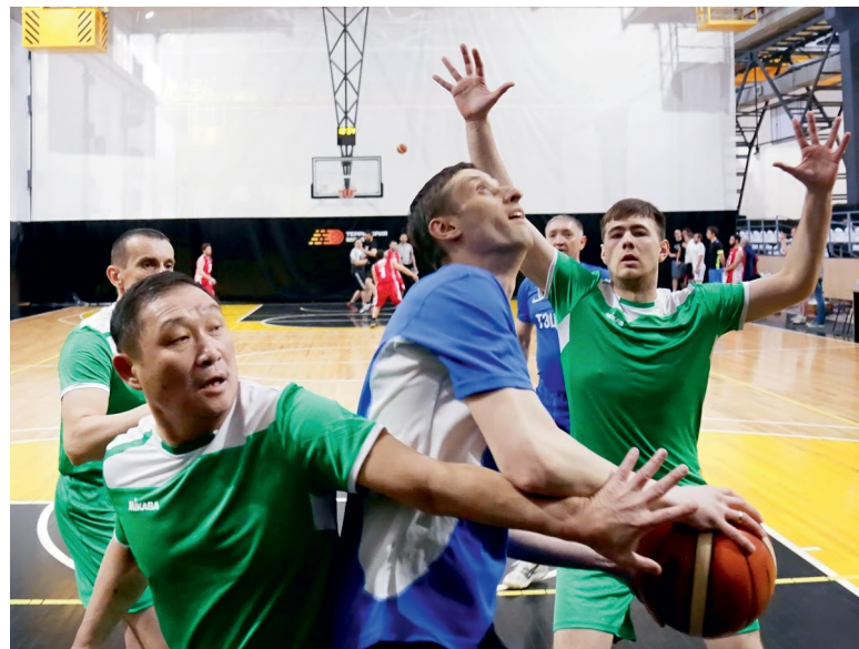
Острый момент в игре между командами ГЭС-1 и ТЭЦ-8

«Я с детства занимался спортом: футболом, волейболом, легкой атлетикой. Потом играл в гандбол за сборную своего училища. В стритболе я новичок, но мне эта игра очень нравится. Здесь важно быстро ориентироваться, видеть своих товарищей по команде. Мы сами с удовольствием участвуем в этих мероприятиях, агитируем коллег присоединиться к нам», – говорит главный специалист диспетчерской