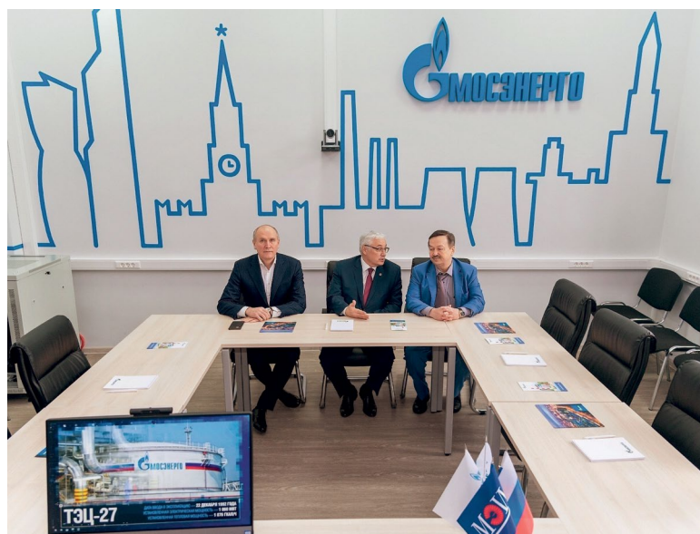
В аудитории Б-216 в Институте тепловой и атомной энергетики МЭИ

Мы всегда рады видеть абитуриентов и студентов МЭИ в нашем корпоративном музее, на производственной практике и, наконец, в качестве постоянных сотрудников компании. Отмечу, что Мосэнерго сегодня один из лучших работодателей в отрасли и заветная мечта многих старшекурсников и выпускников. Для целеустремленных, активных молодых людей наши двери открыты всегда.