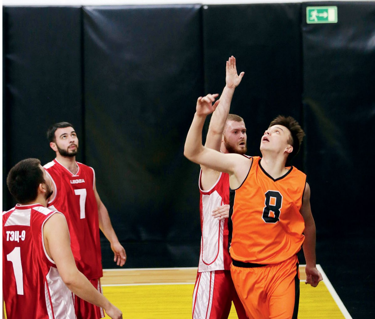
Мяч в кольцо! На поле – стритболисты ТЭЦ-9 и ТЭЦ-22

3 марта в СК «Территория мяча» состоялся турнир по стритболу в рамках спартакиады Мосэнерго. В соревнованиях приняли участие 17 команд, представляющих 15 производственных филиалов компании, Генеральную дирекцию и Мосэнергопроект.