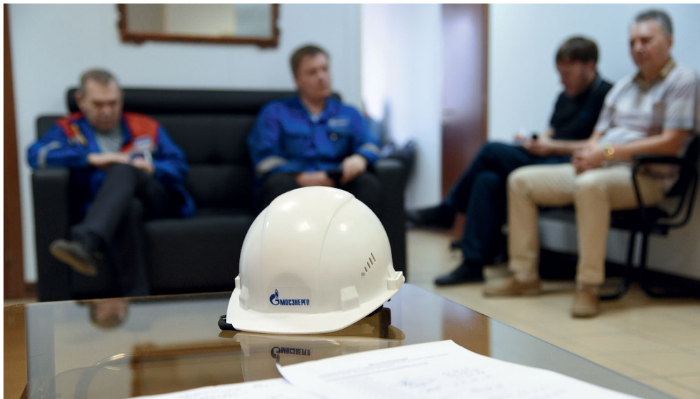
Лекция в рамках Школы здоровья на ТЭЦ-25, август 2019 года

Пилотный проект по профилактике сердечно-сосудистых заболеваний на ТЭЦ-25 признан успешным