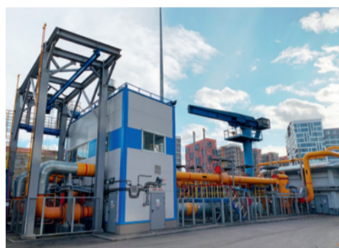
ГРП-2, введенный на электростанции в 2019 году

установки ГТЭ-65 с газовой турбиной АЕ64.3А производства Ansaldo Energia. Новый блок начал работу в апреле 2014 года. Его установленная электрическая мощность составляет 64,8 МВт, тепловая – 15 Гкал/ч. С вводом ГТЭ-65 мощность ТЭЦ-9 увеличилась на 30%, до 274,8 МВт. Новая установка характеризуется высокой маневренностью, а также низким расходом топлива. Ввод ГТЭ-65 позволил повысить надежность энергоснабжения юга и юго-востока столицы, улучшить экологические показатели работы электростанции.