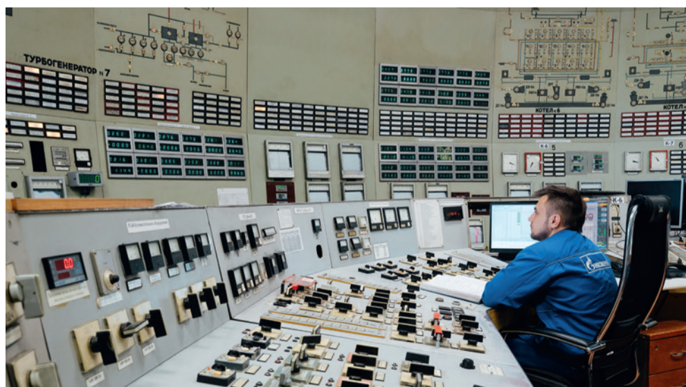
На щите управления ТЭЦ-9

В 2021 году на РТС «Курьяново» введен конденсационный теплоутилизатор котлов № 1, 2. Его применение позволяет обеспечить более глубокую утилизацию тепла дымовых газов водогрейных котлов для последующего дополнительного нагрева сетевого теплоносителя. Благодаря этому достигается ощутимый экономический эффект, повышается топливная эффективность станции.