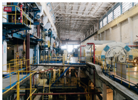
Машинный зал ТЭЦ-9

Значимыми событиями в новейшей истории ТЭЦ-9 стали строительство и ввод в эксплуатацию газотурбинной