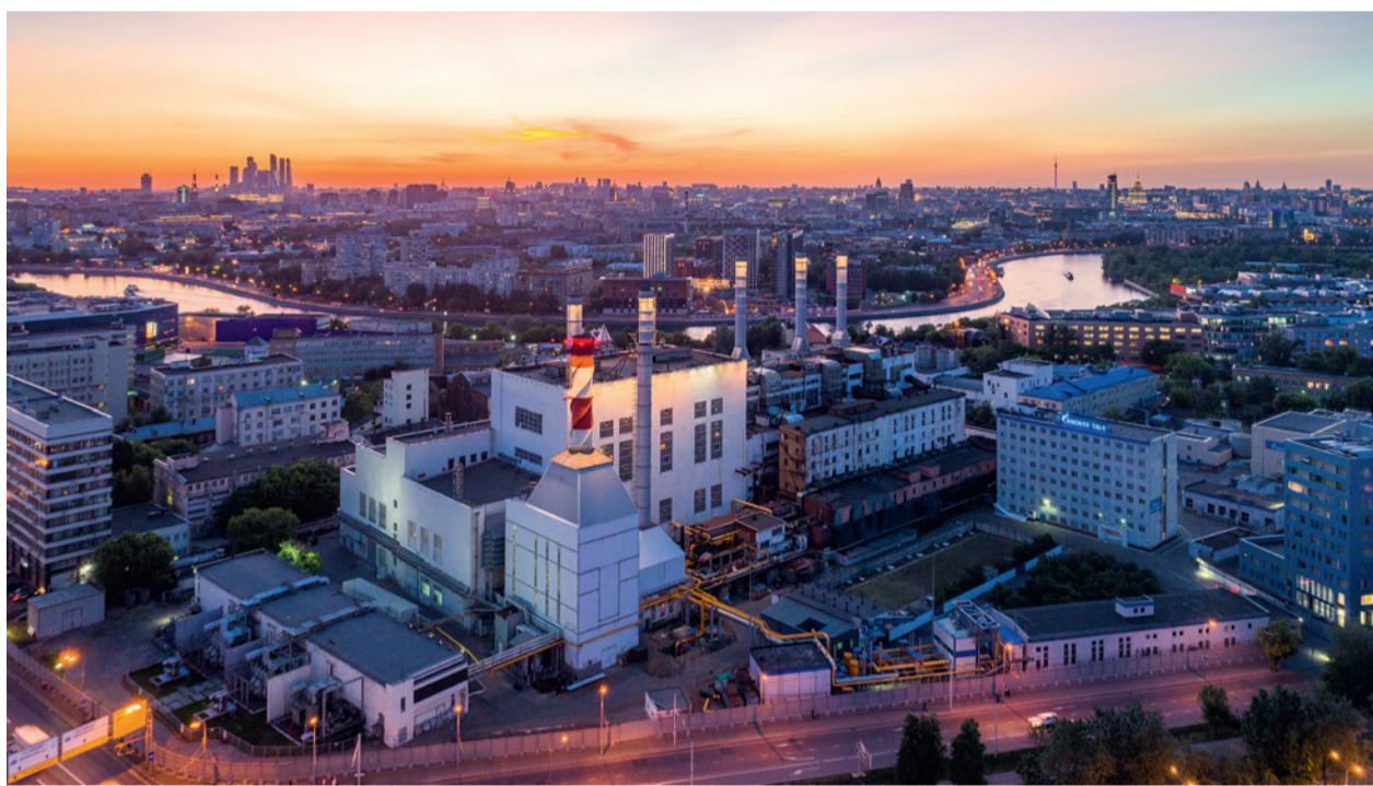
ТЭЦ-9, 2019 год

Решение о сооружении теплоэлектроцентрали высокого давления (ТЭЦ ВД) при Всесоюзном теплотехническом институте было принято в 1931 году Пленумом ЦК ВКП(б). 25 мая 1932 года нарком тяжелой промышленности издал приказ о создании первого советского прямоточного котла и установке его на ТЭЦ при ВТИ. Для разработки проекта было создано Специальное конструкторское бюро ВТИ под руководством профессора Леонида Константиновича Рамзина. Строительство электростанции в Ленинской слободе Пролетарского района столицы осуществлял «ВТИстрой».