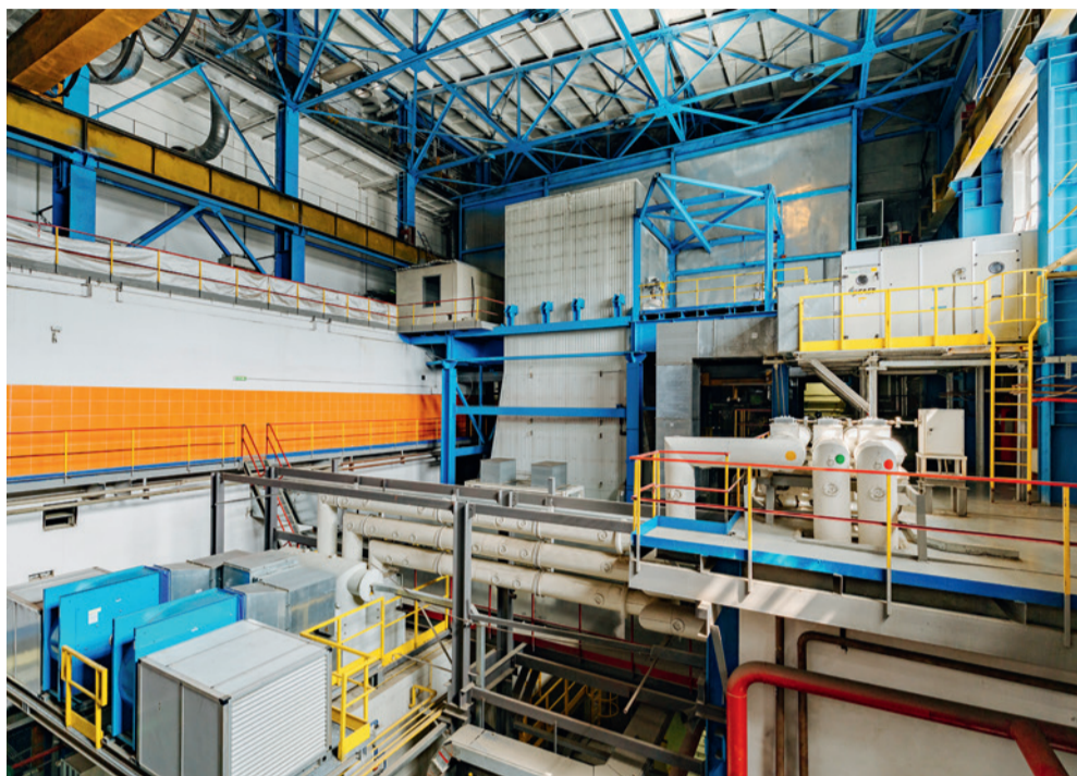
Машинный зал блока ГТЭ-65