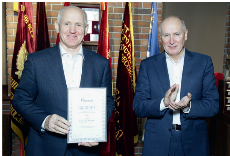
Вручение паспорта готовности, ноябрь 2023 года

– Прежде всего хочу пожелать всем здоровья, благополучия, семейного счастья. Конечно же, новых интересных проектов, профессиональных свершений и непрерывного развития, чтобы достойно встретить 100-летний юбилей нашей электростанции! 🎉