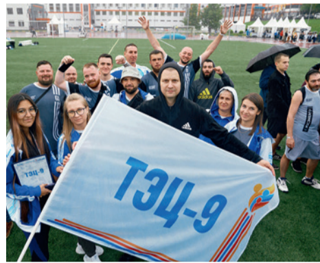
Команда ТЭЦ-9 на Спортивном фестивале Мосэнерго